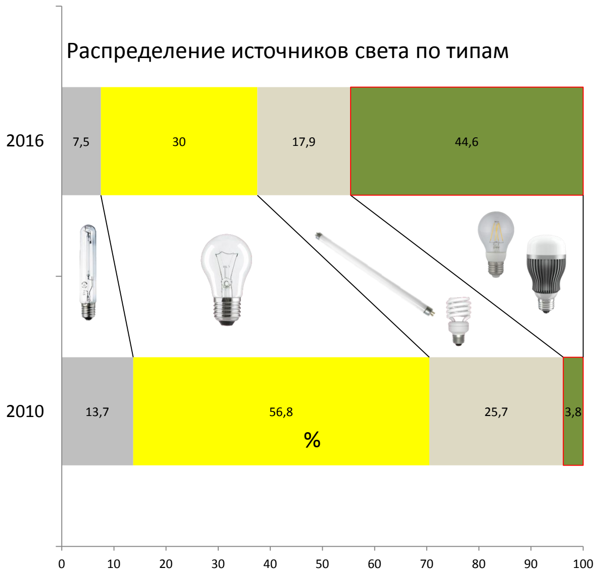
Распределение источников света по типам